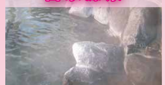
当館敷地内 地下 1,500mから湧出する源泉を加水無しで! 血管拡張作用で血液サラサラ、美容効果で心臓と女性に効く!

3種類の泉質を大露天岩風呂、シルクの湯、壺湯など14種類の多彩なお風呂でお楽しみ頂けます!